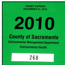
Foto de una etiqueta de permiso

Un vendedor con un permiso del Departamento de Salubridad tiene que cumplir con las reglas de El Código de Salud y Salubridad del Estado de California.